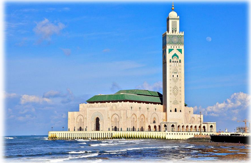
Mezquita Hassan II. Casablanca

PRECIO POR PERSONA EN HABITACIÓN DOBLE: 950 € Suplemento habitación individual: 160 €/total El precio incluye: - 5 noches en media pensión. Alojamiento en los hoteles mencionados o similares de 4**** superior. - 4 comidas en Restaurantes típicos. No bebidas. - Cena Fantasía estándar "Chez Ali" - -Autocar, lujo, A/C a disposición durante todo el circuito. - Guía Nacional hablando español durante todo el circuito. - Entradas a los Monumentos como se indicada. - Seguro asistencial y de viaje. Tasas. - Vuelo ida y vuelta.